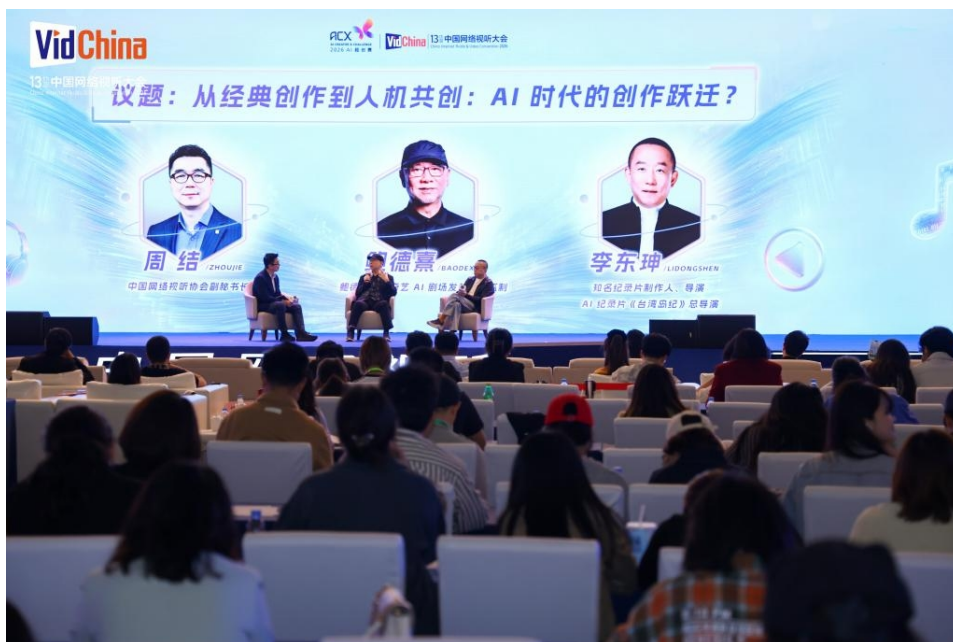
4月16日，第13届中国网络视听大会“AI创作者经济论坛”。